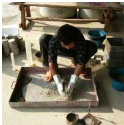
2. ผสมดินกับซีเมนต์ให้เข้ากัน