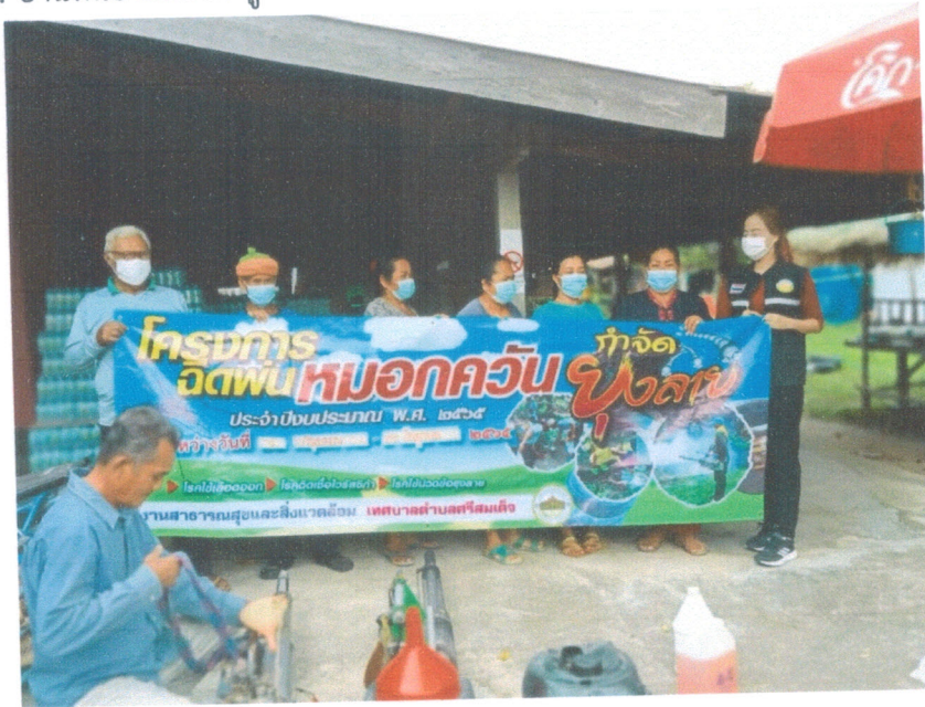
๓. บ้านหนองแสง หมู่ที่ ๙ วันที่ ๘ กันยายน ๒๕๖๕